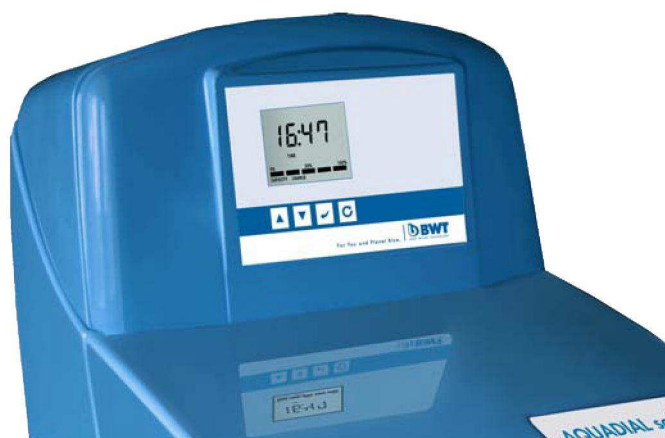
BWT AQUADIAL softlife – дисплей визуализации данных и кнопки управления.