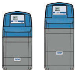
10/ 10 Bio* 15/ 15 Bio*