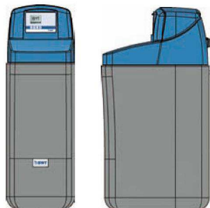
20/ 20 Bio*, 25/ 25 Bio*