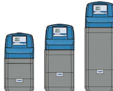
10/ 10 Bio* 15/ 15 Bio* 20 & 25/ Bio* * ЯЧЕЙКА Хлорирования – ОПЦИЯ