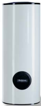
Бак-водонагреватель Logalux SU400

Не важно, ищите ли вы компактный тепловой насос, позволяющий сэкономить место, или мощное устройство, позволяющее обеспечить теплом многоквартирный дом – все это вы найдете в Buderus. Новые рассольно-водяные тепловые насосы Logatherm WPS позволяют иметь практически неиссякаемое тепло, источником которого является сама природа.