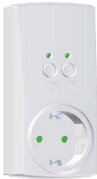
EL-nr 5449903 230 volt

SP16 управляется Беспроводной Системой Управления отоплением iJaz, прост в использовании и не требует профессиональной установки.