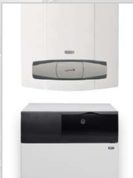
Компоновка настенного одноконтурного котла LUNA 3 Comfort с бойлером