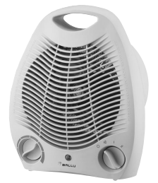
FH - 03 220V 50Hz 2000W