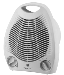
BFH - 02 220V 50Hz 2000W