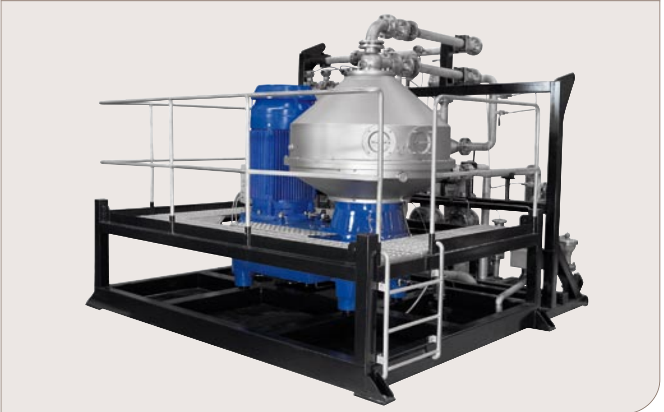
Сепаратор X20 в комплекте с несущей рамой.

Установка X20 компании Альфа Лаваль, модель OFSX 520S-71CEGPX, представляет собой высокопроизводительный сепаратор, предназначенный для очистки пластовой воды от нефти. Основу установки составляет надежная в эксплуатации конструкция тарельчатого центробежного сепаратора, оснащенного барабаном с выгружающими соплами, специально разработанная для эксплуатации в тяжелых условиях нефтедобывающей промышленности. Установка соответствует требованиям Категории 2 Директивы ЕС АTEX по пригодности оборудования для работы в потенциально взрывоопасных зонах с уровнем опасности 1 и 2. В качестве дополнительной опции предусмотрена возможность работы агрегата при избыточном давлении до 400 кПа, с использованием корпуса, рассчитанного для работы под давлением в соответствии с требованиями ASME. Входящий в модельный ряд установок X20 сепаратор X20 также может быть применен в технологических процессах обезвоживания тяжелой сырой нефти и нефтесодержащих песков.