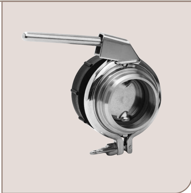
Поворотная заслонка LKBC-2

Примечание. Другие комбинации патрубков, включая патрубки стандартов DS и BS - по требованию заказчика.