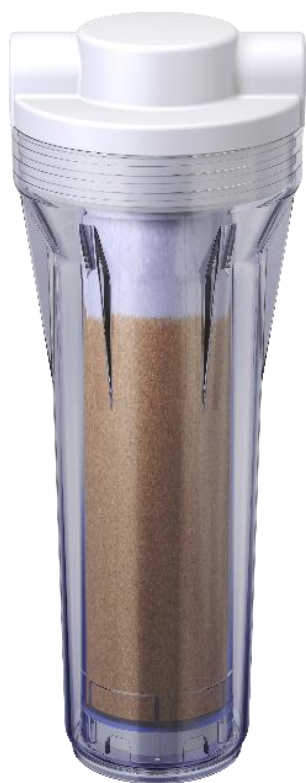
арт. 750 005