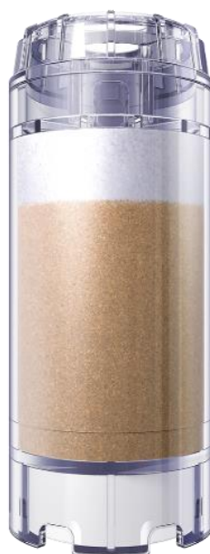
арт. 750 006