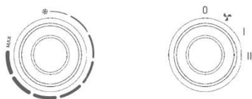
Рис.1 Панель управления

Регулятор слева: переключатель температуры, настройки в диапазоне от 0 до 125°C