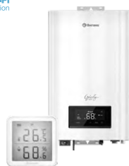
Электрические котлы и комнатные термостаты