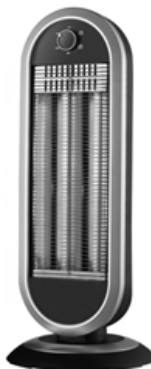
Рис.1 Внешний вид прибора Thermex Espejo 900

Устройство Thermex Espejo предназначено для обогрева жилых помещений. Прибор мобильный, его можно переносить для более удобной эксплуатации, устанавливая на полу, соблюдая правила безопасности.