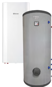
Комбинированные (косвенные) водонагреватели