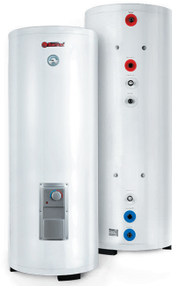
Комбинированные (кос- венные) водонагреватели