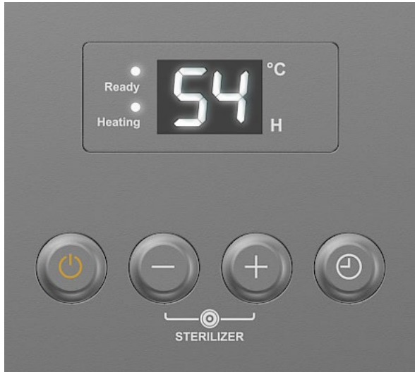
Рисунок 2. Панель управления

Включение/выключение ЭВН осуществляется нажатием кнопки « \text{⏻} ». В процессе эксплуатации ЭВН потребитель может регулировать температуру нагрева нажатием соответствующих кнопок «-» и «+» на панели управления. После однократного нажатия клавиш «-» и «+» температура снижается/повышается на 1°C.