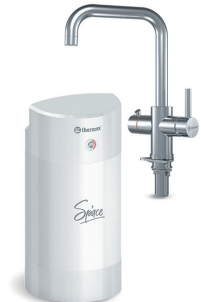
Мультипот система кипячения питьевой воды