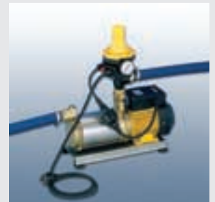
Roth Hauswasserwerk ASPRI 15-4

Das komplett vormontierte Trinkwassernachspeiseset ist DIN-gerecht inkl. vollautom. Regelung zur Nachspeisung in den Tank.