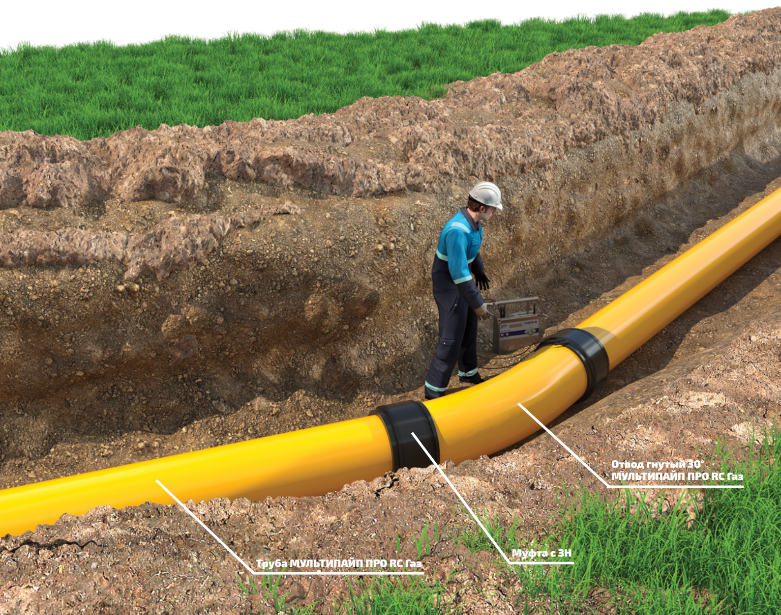
Труба МУЛЬТИПАЙП ПРО РС Газ