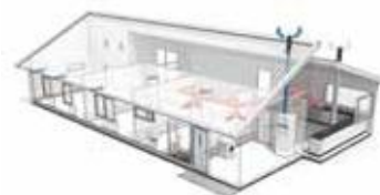
Тепловые насосы выходящего воздуха