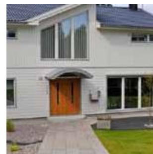
Комфорт - вода