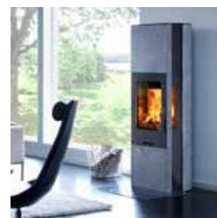
Камины на древесном топливе (с обрамлением)