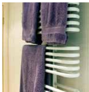
Комфорт - воздух