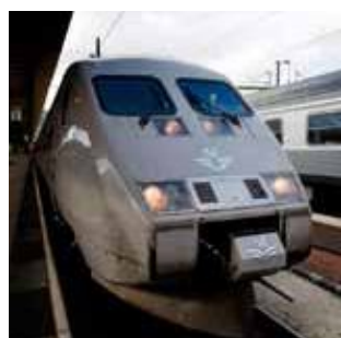
Средства передвижения и транспорт