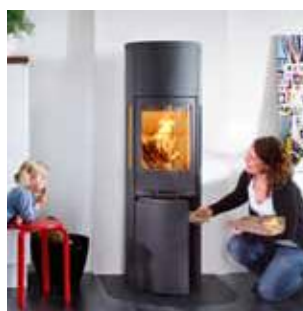
Камины на древесном топливе (листовой металл)