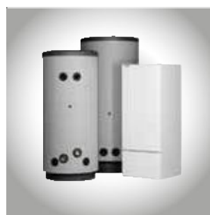
Водонагреватели и накопители