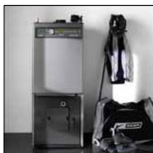
Котлы для домов и горелки для пеллетса