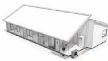
Воздушные/водяные тепловые насосы