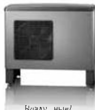
Воздушные/ водяные тепловые насосы