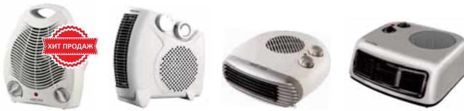
FH-03 FH-06 FH-15 NCS-01