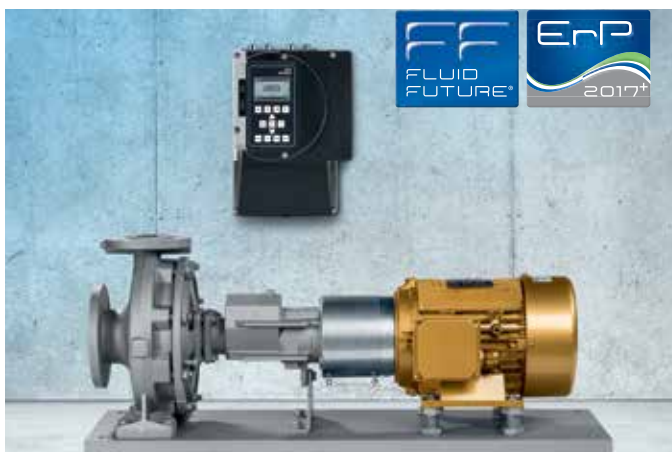
Насос Etanorm в исполнении SYT с двигателем KSB SuPremE®-IE4* и системой частотного регулирования PumpDrive, монтируемой на стене

*IE4 в соответствии с IEC (CD) 60034-30 Ed. 2.