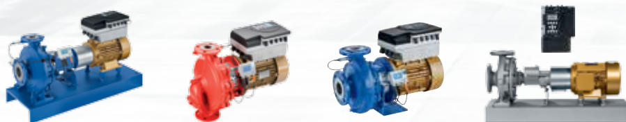
Высокоэффективные насосы семейства Eta нового поколения с двигателями KSB SuPremE® класса энергоэффективности IE4* и системой частотного регулирования PumpDrive.

Насосы семейства Eta изготавливаются в 43 различных типоразмерах. Они комплектуются 2-, 4- или 6-типолюсными двигателями. Дополнительные типоразмеры позволяют расширить диапазон применения и более точно обеспечивать заданные рабочие параметры. Рабочее колесо каждого насоса семейства Eta подрезается под оптимальную рабочую точку. Это – стандарт от KSB.