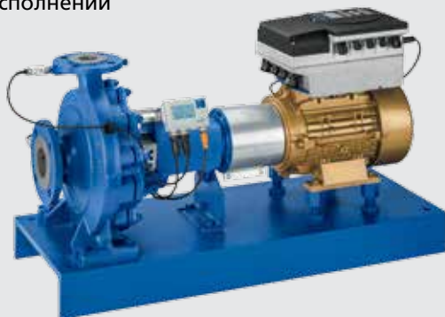
Etanorm с двигателем KSB SuPremE®, PumpDrive и PumpMeter