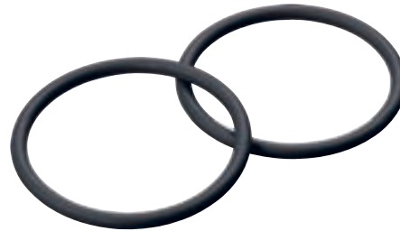
Комплект уплотнений 1" + 1½"

Фильтры тонкой очистки, фильтры с обратной промойкой