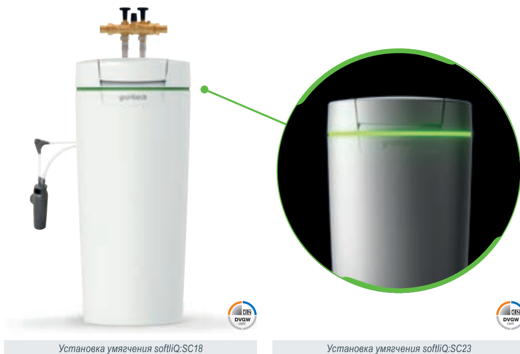
Установка умягчения softliQ:SC18