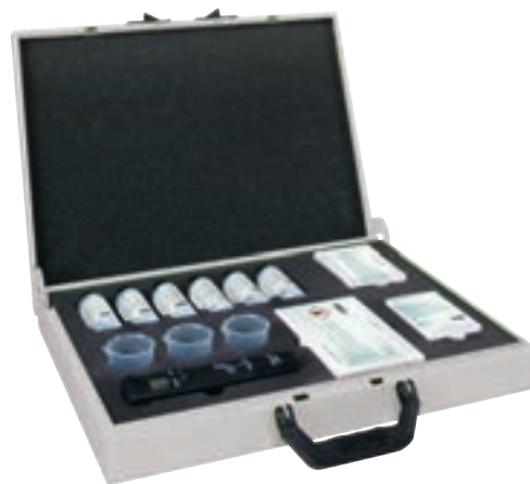
Чемодан для анализа воды GENO-therm Molybdän