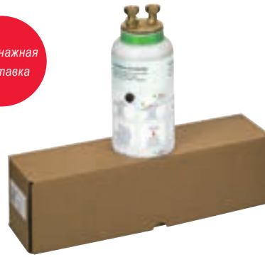
Картуш desaliQ:HB4 с адаптером