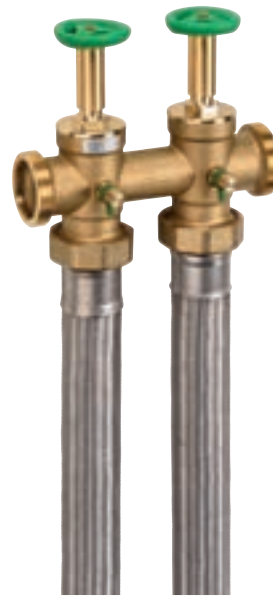
Присоединительный комплект 1 1/2" - 2" монтажная длина 260 мм