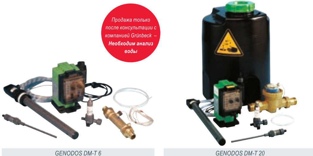
GENODOS DM-T 6