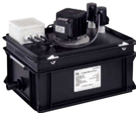
Станция перекачки сточных вод AH-300