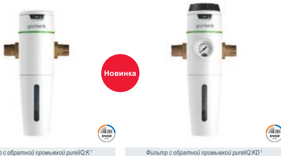
Фильтр с обратной промывкой pureliQ:K 1