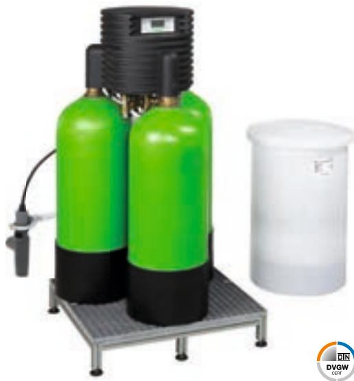
Delta-p 2" на платформе