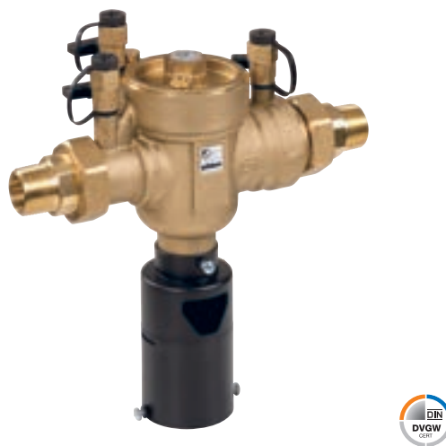
Разделитель систем Euro GENO-DK 2