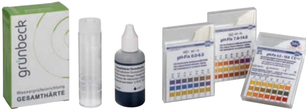
Прибор контроля жёсткости воды °dH и °f