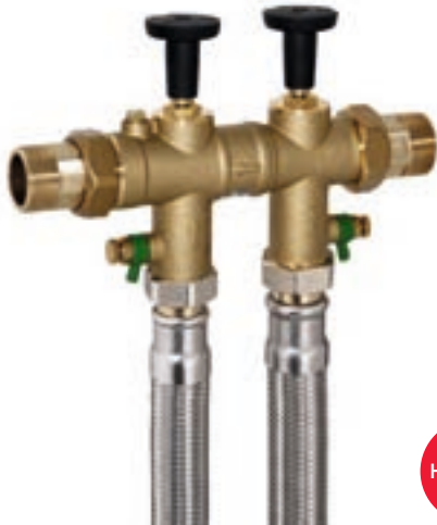
Монтажный комплект 1 1/4"