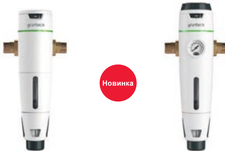
Фильтр с обратной промывкой pureliQ:R