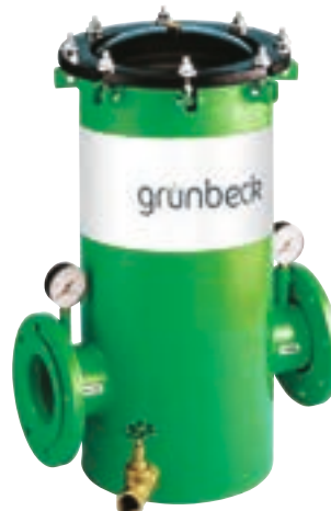
Фильтр тонкой очистки GENO FM