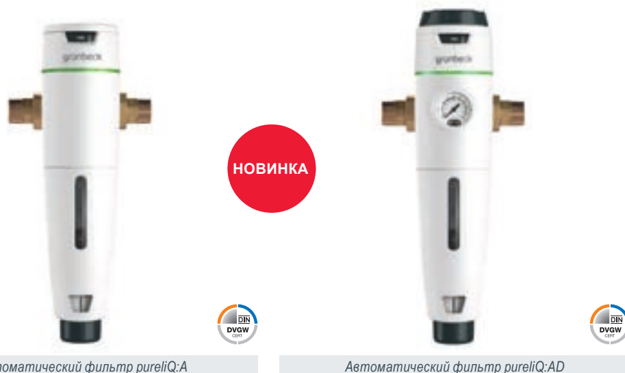
Автоматический фильтр pureliQ:A