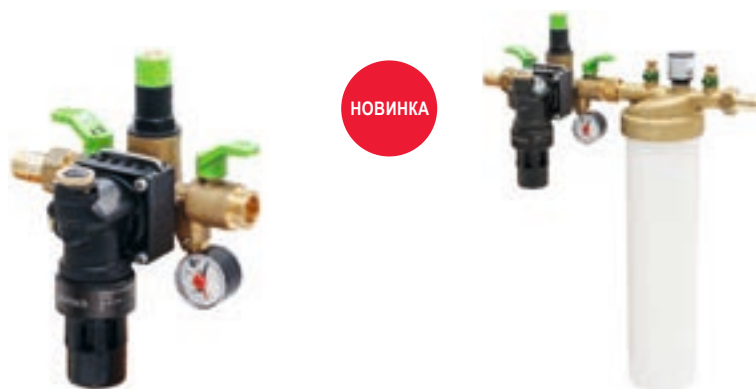
Группа заполнения систем thermaliQ:SB13