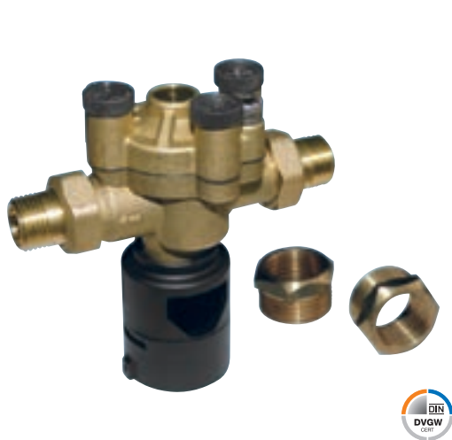
Разделитель систем Euro GENO-DK 2-Mini