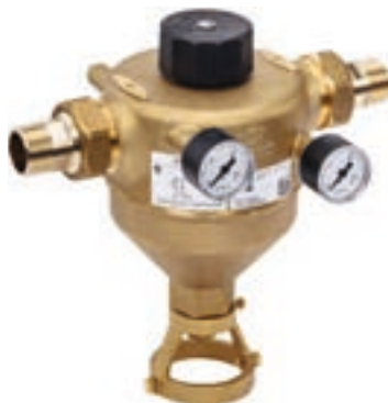
Фильтр с обратной промывкой GENO MX с резьбовыми соединениями