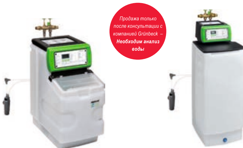
Установка удаления нитратов WINNI-mat VGX-N 50 1