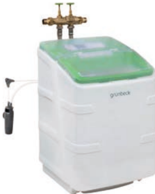
Weichwassermeister GSX 10-I 1