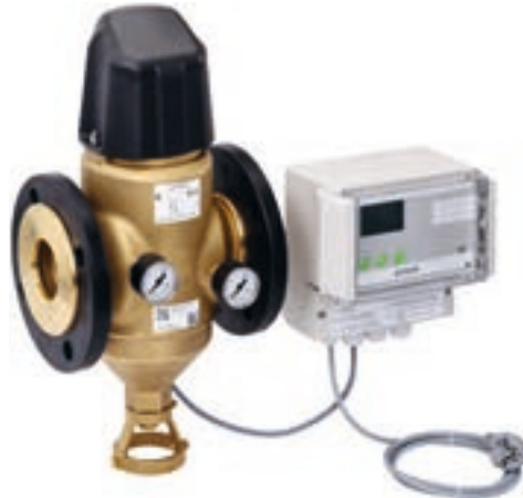
Фильтр с обратной промывкой GENO MXA с фланцевыми соединениями

Фильтры тонкой очистки, фильтры с обратной промывкой