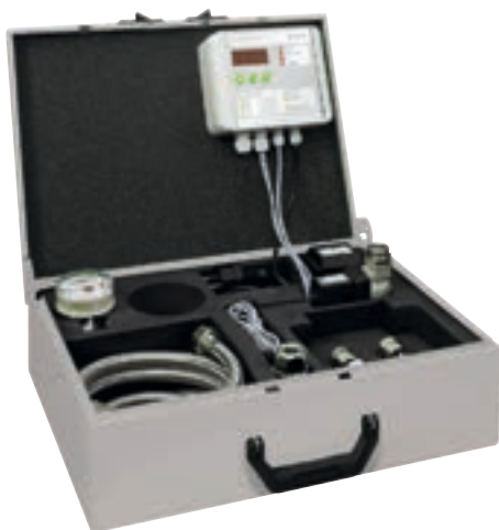
Чемодан GENO-therm Premium