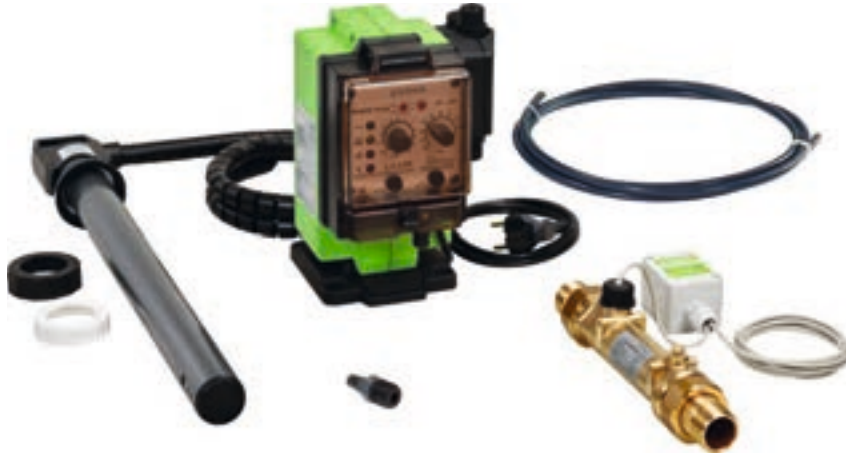
GENODOS DM-oxi 1"