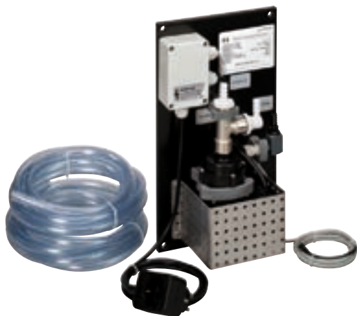
Насос подачи воды для регенерации