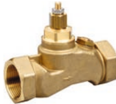
Механический смеситель 1 1/4"