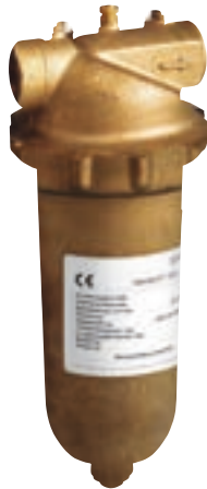
Фильтр тонкой очистки GENO S-WW