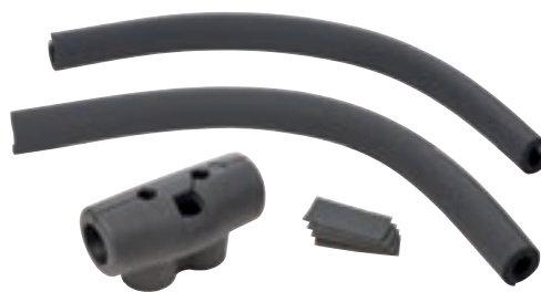
Комплект изоляции softliQ:SC