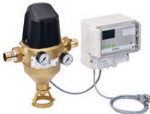
Фильтр с обратной промывкой GENO MXA с резьбовыми соединениями