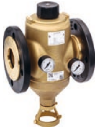
Фильтр с обратной промывкой GENO MX с фланцевыми соединениями