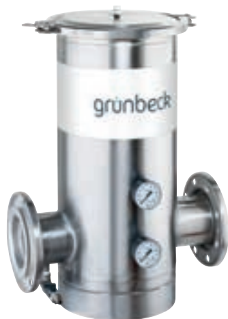
Фильтр тонкой очистки GENO FME