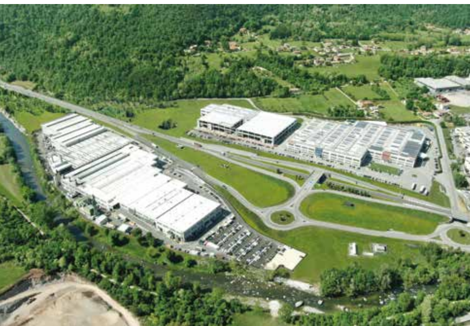
Производственные площадки Fondital Spa в г. Карпенедиа ди Вобарно (Брешиа, Италия)