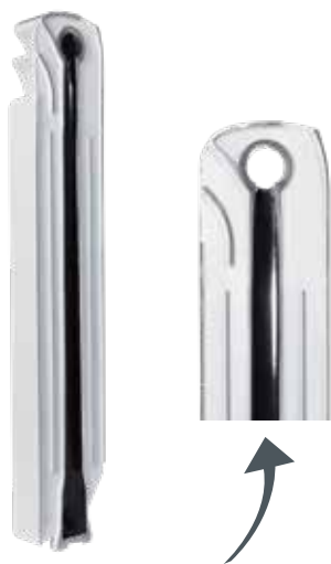
Внутренняя обработка Aleternum® компании Fondital

Коррозия – это основная причина повреждений отопительной системы. Со временем находящаяся в контакте с водой поверхность металла подвергается разрушительному действию коррозии и приводит к значительному снижению эффективности системы с одновременным увеличением затрат. Например, коррозия в системе, состоящей из стальных или чугунных радиаторов, приводит к появлению отложений на дне радиатора, которые засоряют трубы и сами радиаторы, что приводит к частичному либо полному снижению теплоотдачи и перепадам в распределении тепла. В обычных алюминиевых радиаторах коррозия приводит к образованию газовых скоплений (воздушные пробки), которые не позволяют радиатору разогреться равномерно и могут снизить его теплоотдачу. Во избежание появления коррозии компания Fondital изобрела Aleternum®: эксклюзивную обработку внутренней поверхности радиатора на основе смолы для защиты его водяной камеры. Радиаторы Fondital с обработкой Aleternum® представляют собой новую эру тотальной защиты и являются синонимом безопасности и высоких показателей теплоотдачи. Ваша система отопления всегда будет как новая!