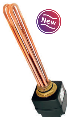
SL Set 4.5