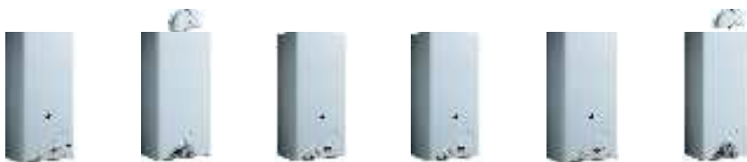
ТАБЛИЦА ТЕХНИЧЕСКИХ ХАРАКТЕРИСТИК