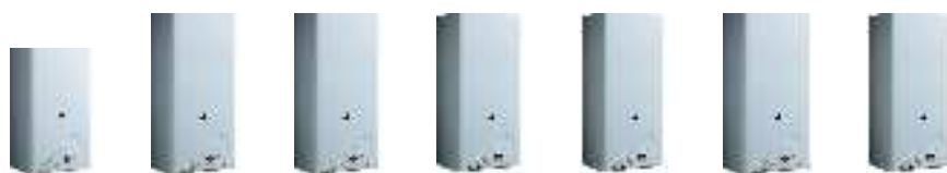
ТАБЛИЦА ТЕХНИЧЕСКИХ ХАРАКТЕРИСТИК