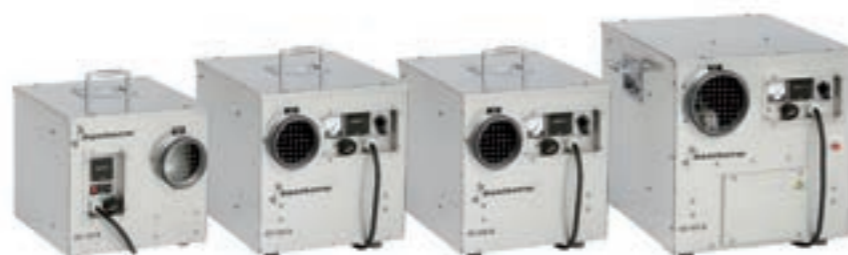
Технические характеристики адсорбционных осушителей AD