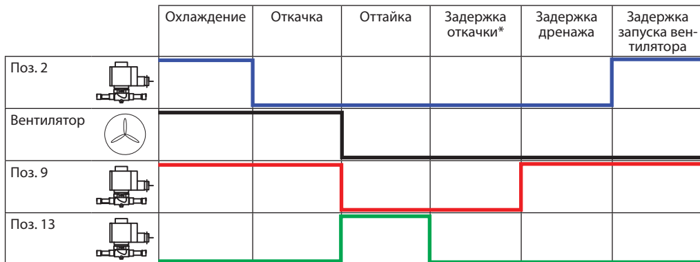
Рис. 2 Циклограмма процесса оттайки.

* В режиме «Задержка откачки» соленоидные клапаны поз. 2, 9, 13 закрыты. Байпасный соленоидный клапан на линии всасывания поз. 10 открыт.