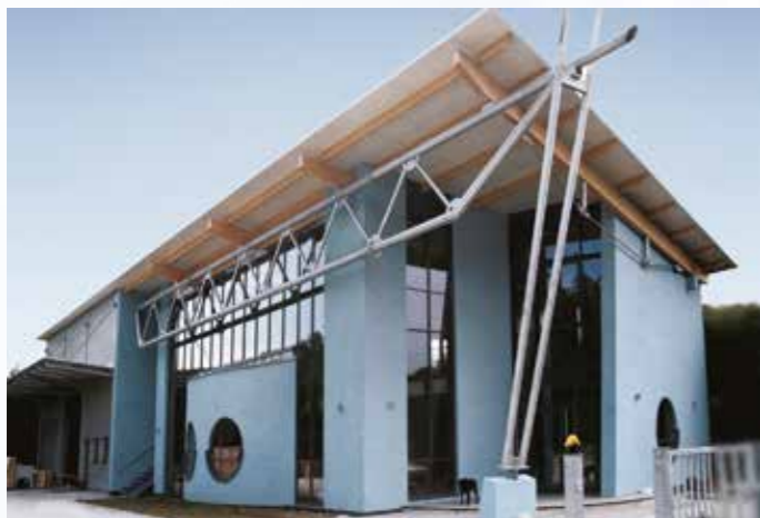
SABERO центральный офис в Графрат, Германия