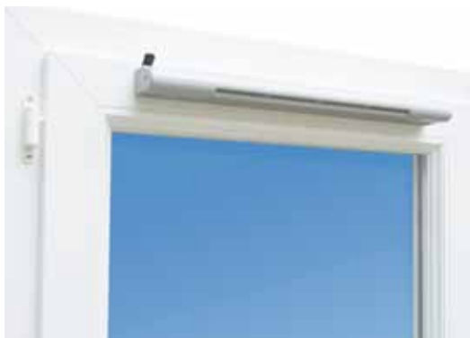
1 Гигрорегулируемое приточное устройство, установленное на окне.