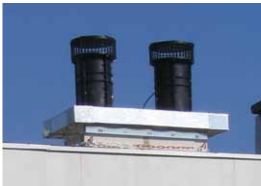
4 Вентиляторы низкого давления, установленные на оголовках вентканалов.

Подавляющее количество уже построенных и строящихся сейчас жилых домов оснащены так называемой «системой естественной вентиляции». В такой системе изначально подразумевается приток свежего воздуха через щели в окнах и удаление грязного воздуха через вытяжные каналы на кухне, ванной и туалете. Такая вытяжка может обеспечить нормативный воздухообмен только в течение 50% времени года, в теплый период года она работает неэффективно или не работает вообще. Кроме того, современные герметичные окна со стеклопакетами щелей не имеют и поэтому снижают воздухообмен в квартирах еще больше. Периодическое проветривание эту проблему не решает, а держать окна все время приоткрытыми невозможно из-за уличного шума и сквозняков. Итог этого – духота в квартирах, конденсат на стеклах, грибки и плесень на откосах и стенах, плохое качество воздуха.