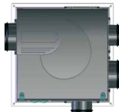
Индивидуальный вентилятор с низким уровнем собственного шума

По классификации СНиП 23-02-2003 «Тепловая защита зданий», табл.3, класс энергетической эффективности такого здания считается «высоким» и для него органам администрации субъектов РФ рекомендуется обеспечить экономическое стимулирование.