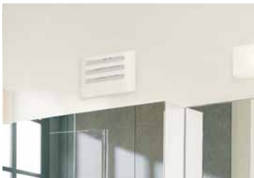
2 Гигрорегулируемое вытяжное устройство, установленное в ванной комнате.