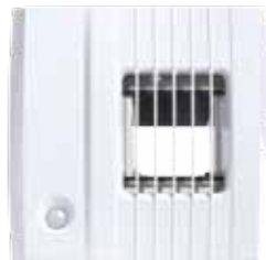
Многофункциональное вытяжное устройство.