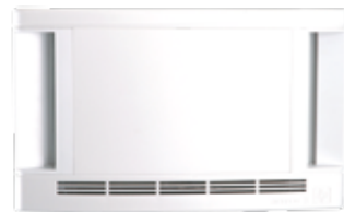
Стеновое гигрорегулируемое приточное устройство.

Компания Aereco предлагает комплексное решение вопросов комфорта и снижения эксплуатационных расходов путем создания в жилых домах саморегулирующихся автоматических вентиляционных систем с технологией гигрорегулирования (управление воздухообменом по уровню влажности внутреннего воздуха и присутствию жильцов). Энергосберегающий эффект обеспечивается путем автоматического снижения нормативного воздухообмена во временно пустующих помещениях. Технологически установка энергоэффективной вентиляционной системы сводится к монтажу приточных шумозащитных оконных или стеновых устройств в жилых комнатах (спальнях и гостиных), установке автоматических вытяжных решеток на кухнях, в ваннах и туалетах, реагирующих на изменение влажности воздуха и/или присутствие человека, и установке индивидуальных механических вытяжных вентиляторов в квартире или вентиляторов общего пользования на крыше/чердаке.