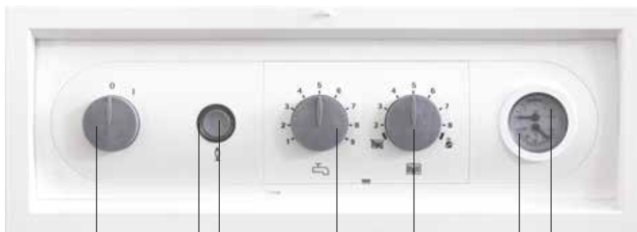
Рабочий выключатель ВКЛ./ВЫКЛ. Светящаяся окружность Кнопка квитирования Регулятор температуры ГВС Регулятор температуры системы отопления Термометр Манометр (не для CGB-75/100)