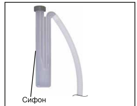
Рисунок: Сифон CGB-75/100