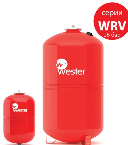
WRV 50 - 10 000, 16бар

Внимательно прочитайте перед монтажом и эксплуатацией