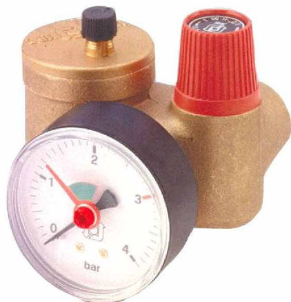
KSG 30 N