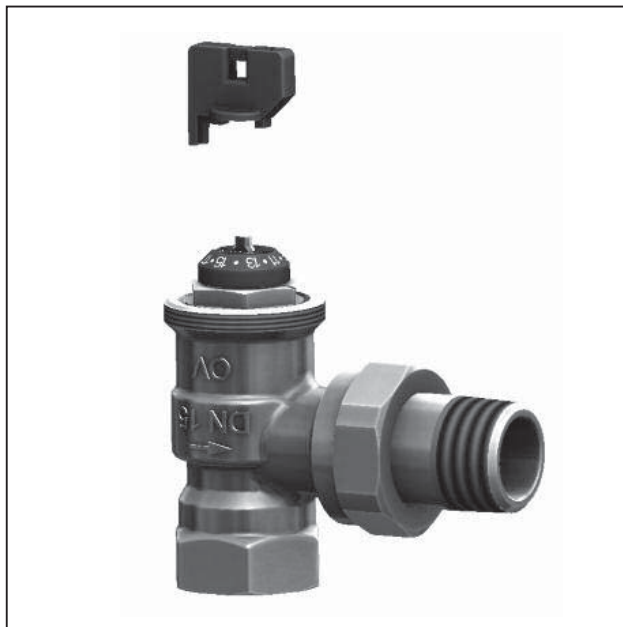
Рис. 1 Термостатический вентиль „AQ“

OVENTROP GmbH & Co. KG Paul-Oventrop-Strasse 1 D-59939 Olsberg Телефон +49 (0)29 62 82-0 Telefax +49 (0)29 62 82-400 E-Mail mail@oventrop.de Internet www.oventrop.com