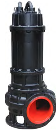
Группа продукта J