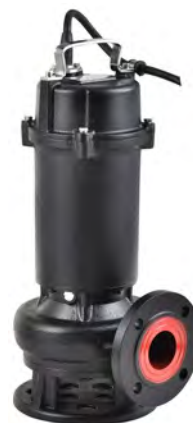
Группа продукта J