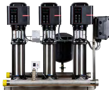
Группа продукта Н