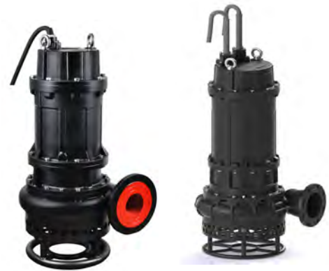
Группа продукта J