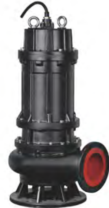
Группа продукта J