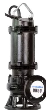
Группа продукта J