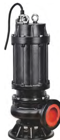
Группа продукта J