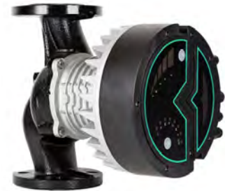
MEGA S, 1x230 В