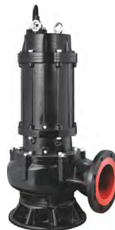
Группа продукта J