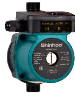
PROMO, 1x230 В