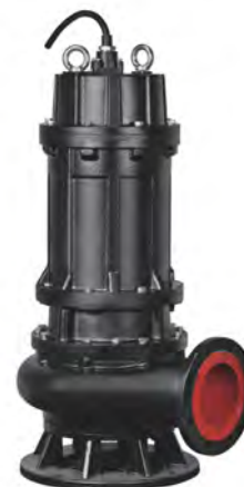
Группа продукта J