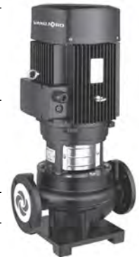
Группа продукта F