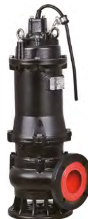
Группа продукта J