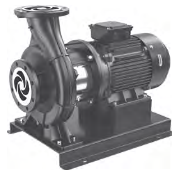
Группа продукта F