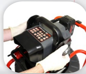
Ручка – для переноски всей системы видеодиагностики в одной руке