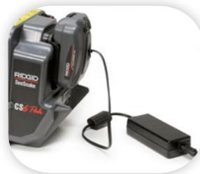
Переходник переменного тока (опционально)