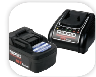
Аккумулятор 18 В Advanced Lithium 4.0