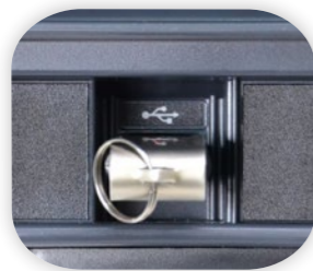
Запись непосредственно на USB (USB-карта 8 GB включена)

Программное обеспечение SeeSnake® HQ™ для редактирования, архивирования и рассылки отчетов в распечатанном виде, на DVD или в онлайн-режиме.