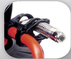
Самовыравнивающаяся камера 25мм