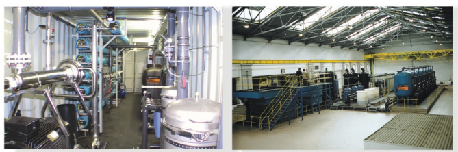
Станция опреснения морской воды на греческом острове Итака, проток воды 800 м³/день