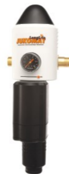
JUKO-LF-A 3/4" - 1 1/4"