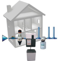
Схема установки для систем водоснабжения

Система защиты от коррозии и солей жесткости компании JUDO. Схема показывает в какой последовательности нужно подключать установки JUDO после счетчика воды: фильтр обратной промывки PROFI PLUS, умягчитель QUICKSOFT DUO и дозирующий насос JULIA.