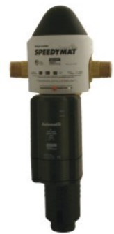
JSY-LF-A 3/4" - 1 1/4"