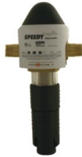
JSY-LF 3/4" - 1 1/4"