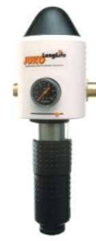
JUKO-LF 3/4" - 1 1/4"