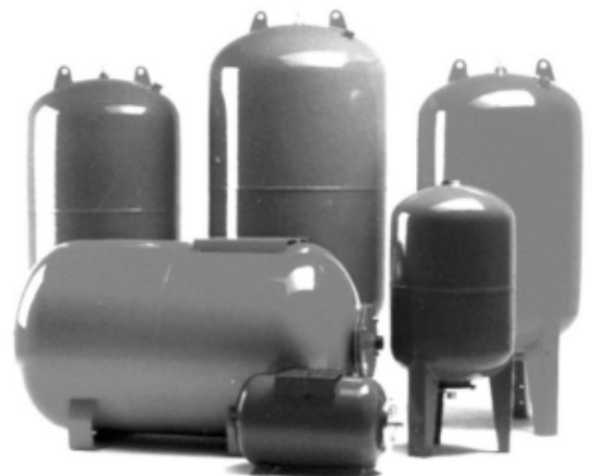
Гидроаккумулирующие мембранные баки ULTRA-PRO, WATER-PRO