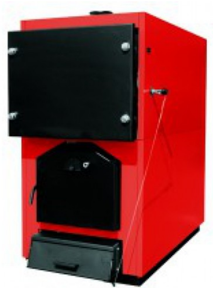
Wirbel Eko Cks 200