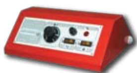
Пульт управления котла при работе с горелкой (опция)

Стальной водогрейный котел центрального отпления ЕКО-СК мощностью от 20 до 110 kW работающий на твердом топливе (дрова, уголь). При снятии заглушки нижней двери и установке пульта управления котел может работать с наддувной горелкой на солярке, газе или на пеллетах. Котел имеет лабиринтную конструкцию (топочная камера + 3 горизонтальных хода), позволяющую максимально использовать теплоту продуктов сгорания. При изготовлении котла применены качественные материалы и современные методы производства. Котел отвечает требованиям Европейских Норм EN 303-5.