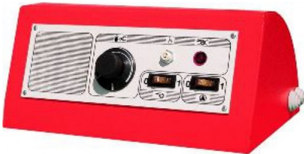
Автоматика горелки для котлов Wirbel