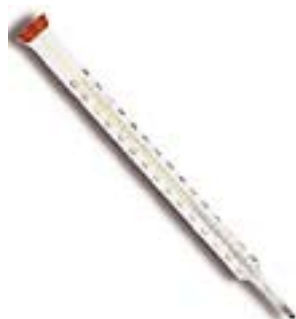
Спиртовой термометр T-200V