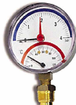
Термоманометр TMRA (радиальное подключение)