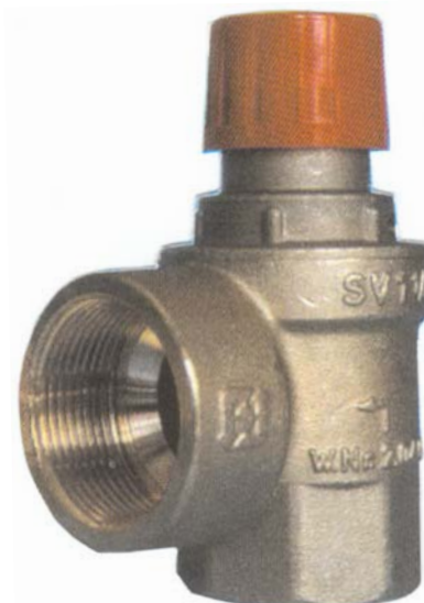
SVH 30x1 1/4"