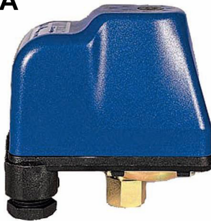
Реле давления РА 5 MI