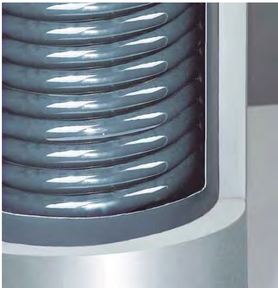
Бойлер из нержавеющей стали с объемом 110 литров

Приготовление ГВС за 10 минут - Температура воды в бойлере 60°C - Температура воды на входе 15°C