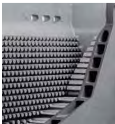
Ультеракомпактный, полностью охлаждаемый теплообменник из сплава Al/Si/Mg