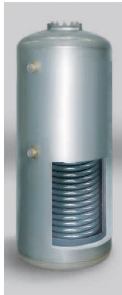
Бойлер из нержавеющей стали марки AISI 316 L с объемом 110 л