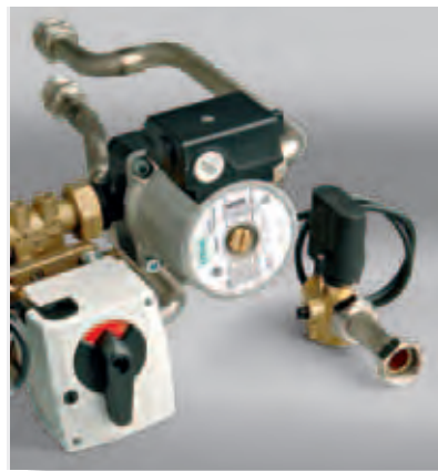
Смесительный клапан, насосная группа и отсекающий электрический комплект