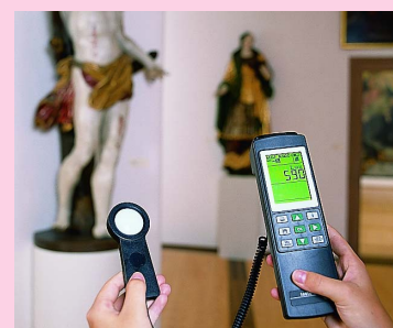
Измерение освещенности в музеях