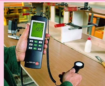
Измерения уровня освещенности на рабочих местах