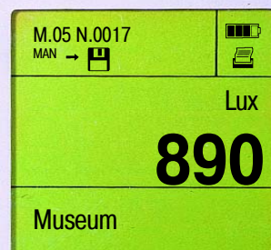
Встроенное управление данными с соотнесением к месту замера