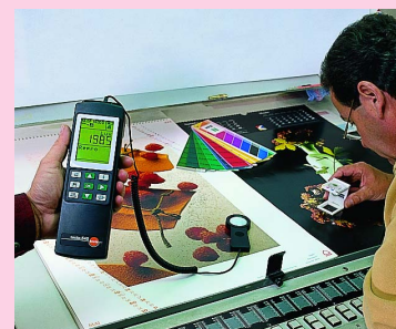
Расчет среднего значения в множительной студии