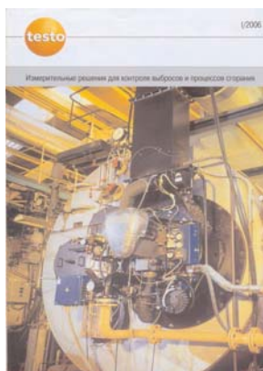
Каталог измерительные решения для контроля выбросов и процессов сгорания