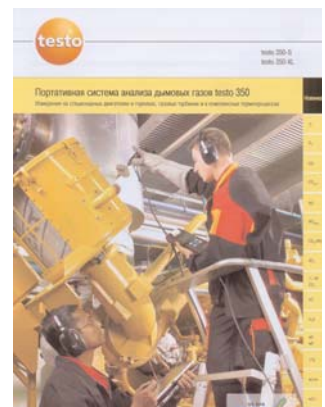
Портативная система анализа дымовых газов testo 350