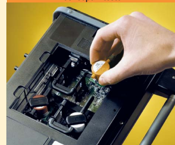
Замена ячеек пользователем