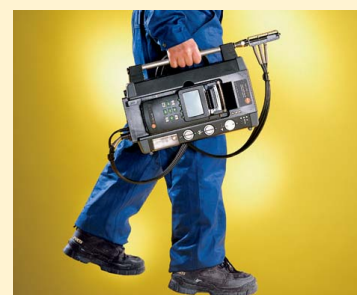
Полный комплект Практичный и компактный