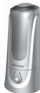
Модель АН 3–200 ТС