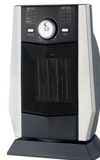
Модель SHL 1512 TC