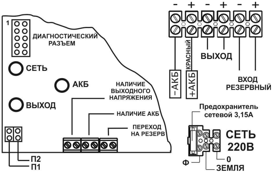
Рисунок 1. Вид источника с открытой крышкой (схема подключения)