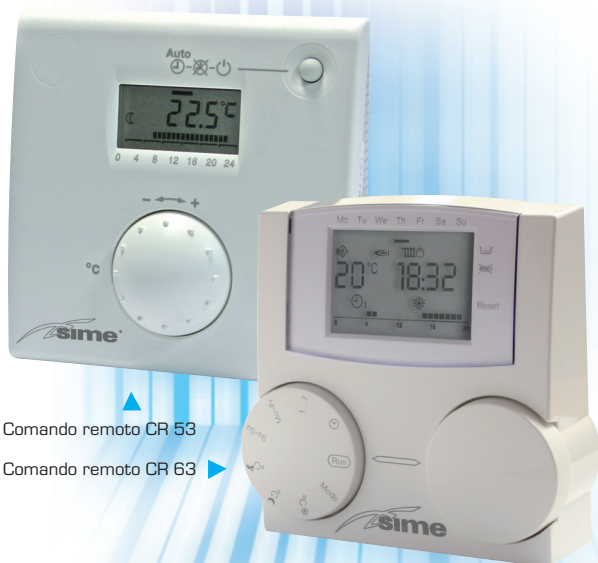
Comando remoto CR 53