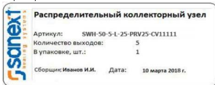
Рис. 1. Пример маркировочного стикера