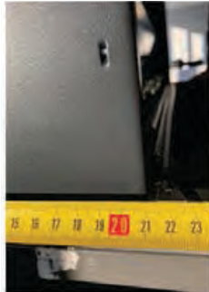
Глубина – 21 см (включая отверстие для кабеля).