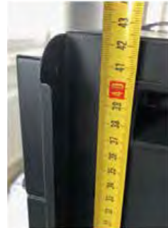
Высота – 42,5 см