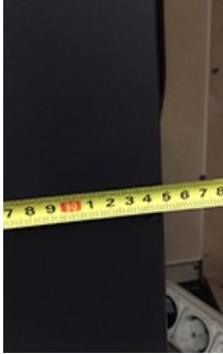
Ширина – 95 см (включая крепежные выступы).